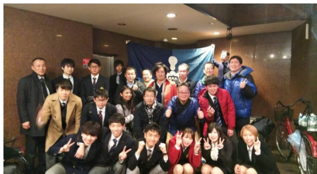
2019年2月23日(土)追出しコンパ