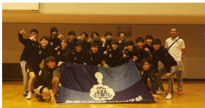
入替戦終了後 滋賀県立体育館にて

リーグ戦は無事終えられたものの、会場等の都合で入替戦まで1ヶ月以上期間が空くことになりました。その間に選手たちのモチベーションを下げないように、こまめなミーティングや選手それぞれに役割を与えたり、練習メニューを一緒に考えたりと、様々な工夫をしました。